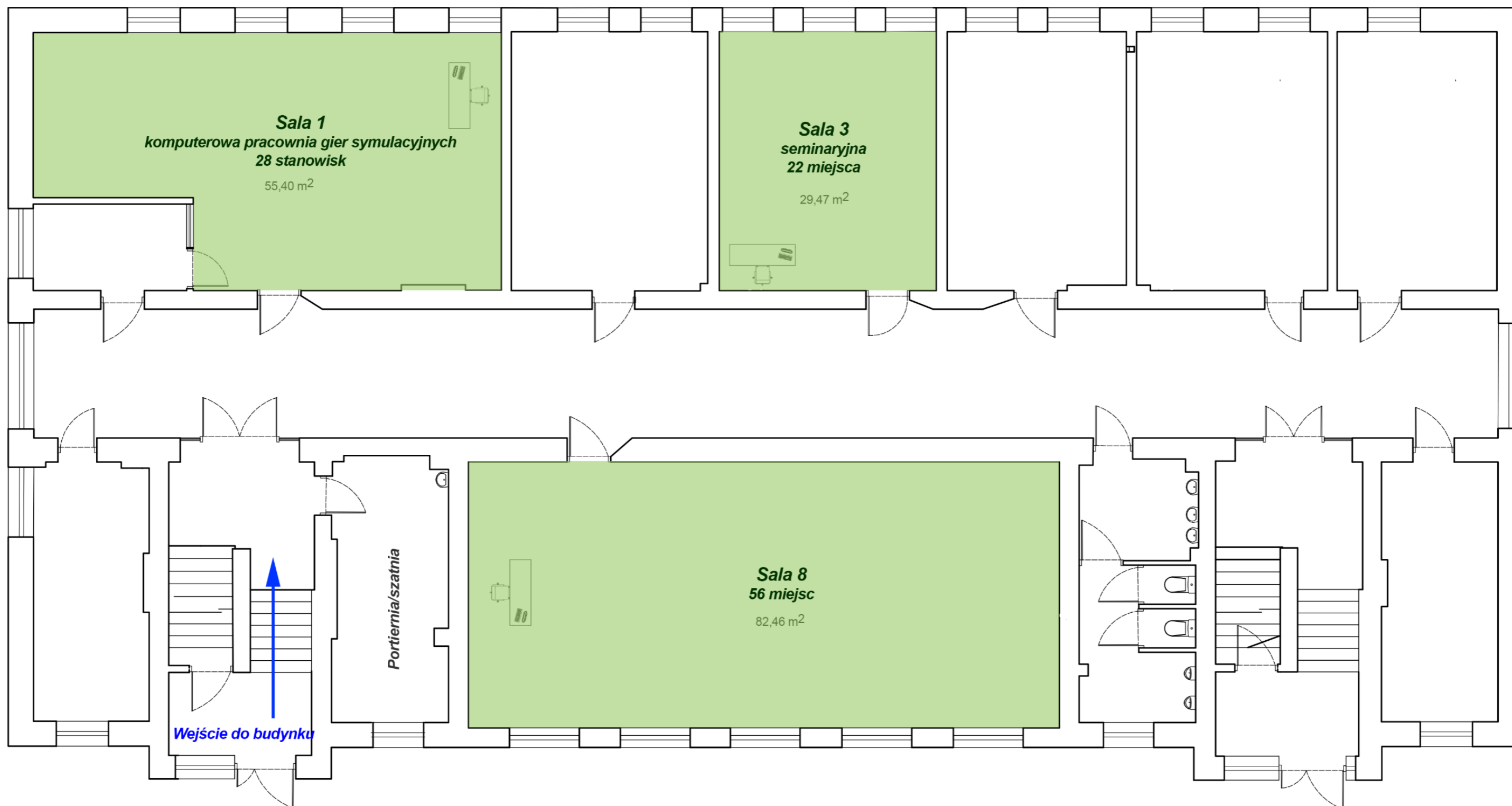
RZUT PARTERU ul. R. Prawocheńskiego 19