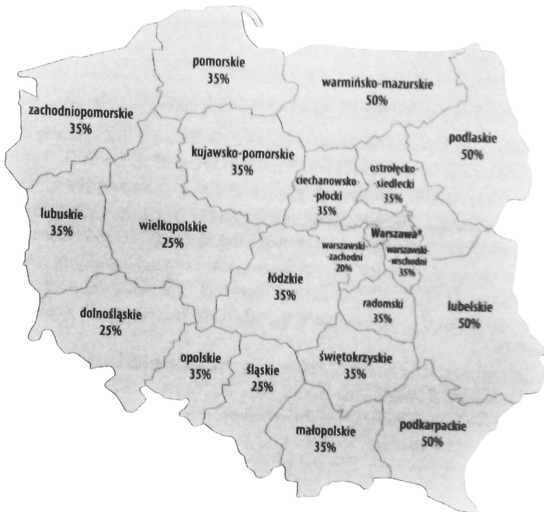
Rys. 1. Mapa pomocy regionalnej w Polsce (2014-2020)