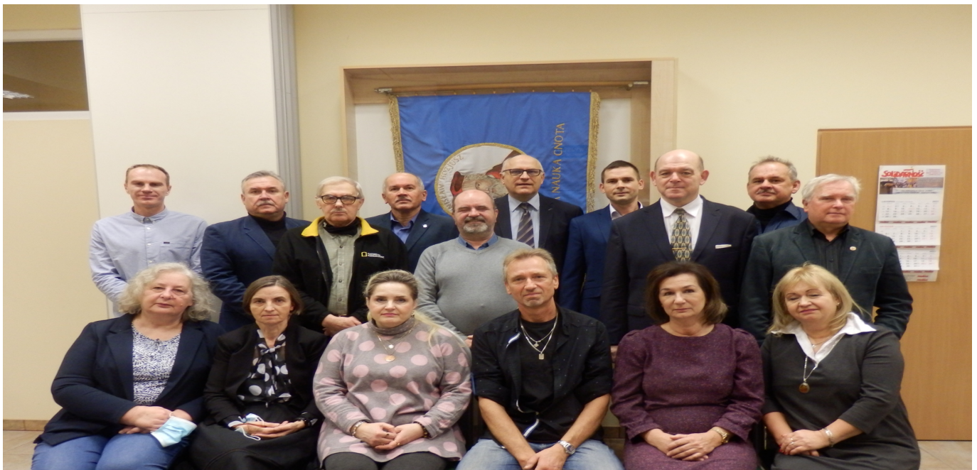
KOMISJA ZAKŁADOWA NSZZ SOLIDARNOŚĆ W KADENCJI 2018-2023

KZ NSZZ „Solidarność” UWM oferuje swoim członkom profesjonalizm i doświadczenie.