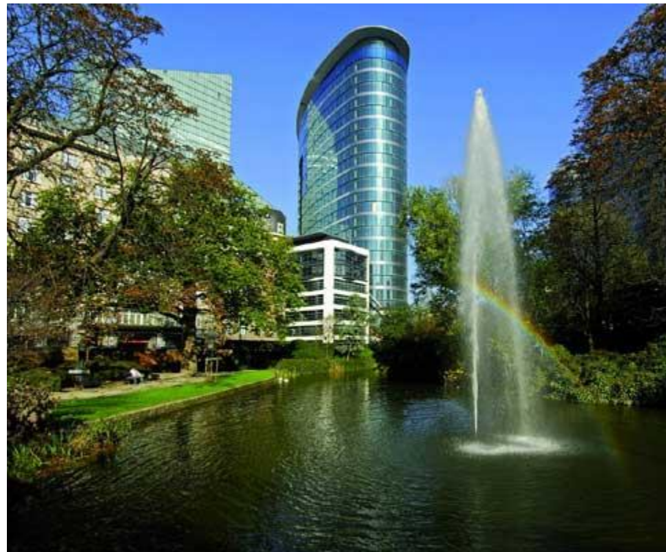
Covent Garden Brussels