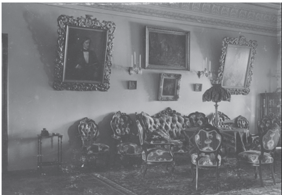
Fot. 3. Nowy salon.