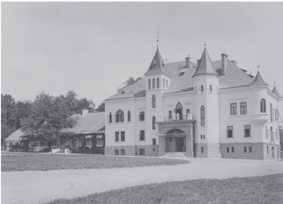
Fot. 1. Widok całego pałacu w Brzostowicy Wielkiej od dziedzińca.

Wielka Brzostowica przekazywana po kądzieli, a nie po mieczu, dzięki Ludwice Potockiej weszła w dom Kossakowskich w XVIII wieku. Przez następne dwa stulecia pozostawała we władaniu tegoż rodu. Uzyskanie tego majątku pozwoliło Kossakowskim stworzyć jedną z większych fortun magnackich na ziemiach zabranych. Do chwili obecnej badania nie pozwalają na dokładne stwierdzenie, jak była administrowana Wielka Brzostowica. Można jedynie wnioskować, że przynosiła pokaźny dochód, skoro w przeciągu trzech lat Józef Kossakowski wystawił nowy pałac w majątku. Poza tym zebrane dzieła sztuki, wartościowe przedmioty, uzupełniane przez kolejne pokolenia Kossakowskich sprawiły, że pałac brzostowicki stał się prawdziwym miejscem kultury. Dziś zbiory brzostowickie nie istnieją. Jedynie niewielka część pozostaje w rękach rodziny.