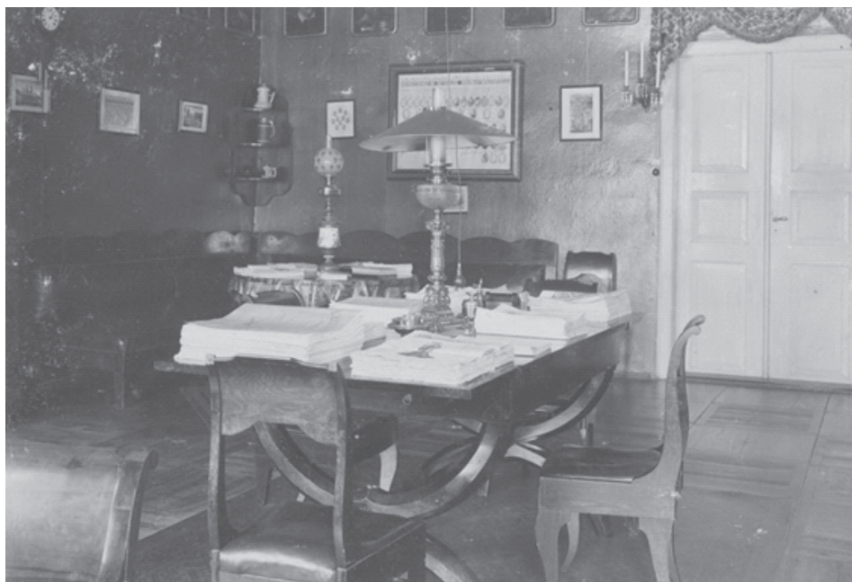
Fot. 5. Biblioteka.