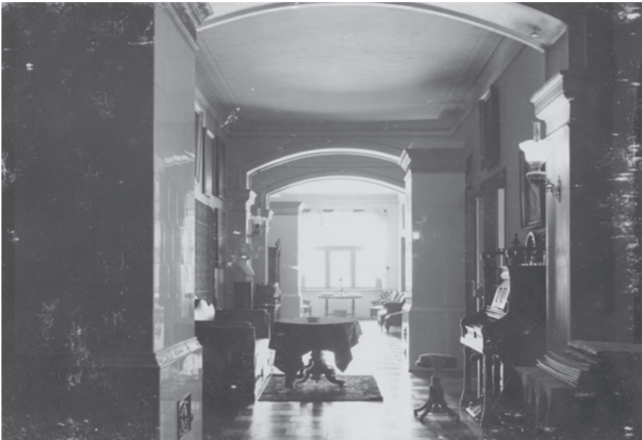
Fot. 7. Korytarz na dole.