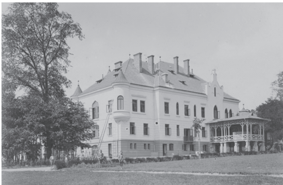
Fot. 2. Widok całego pałacu w Brzostowicy Wielkiej od ogrodu.