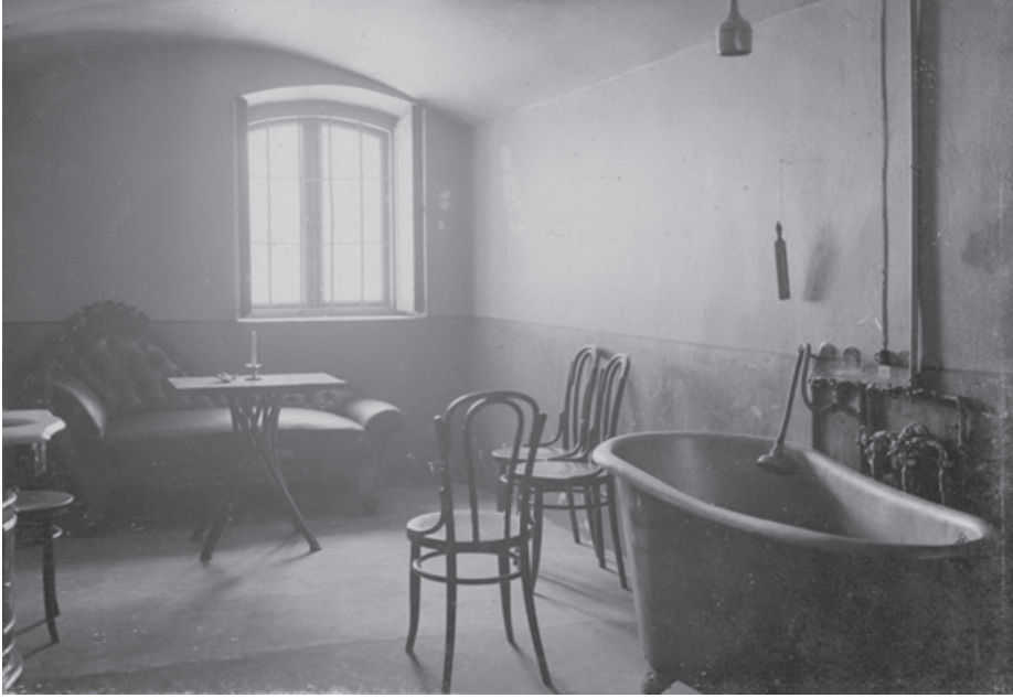
Fot. 8. Łazienka na dole.