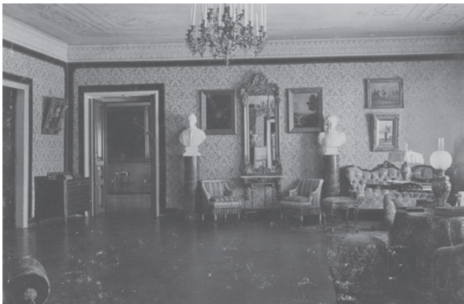
Fot. 4. Stary salon.