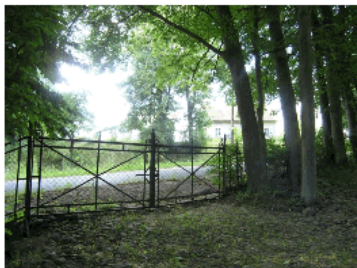
Fot. 14. M. Swaryczewska Fragment historycznego ogrodzenia

Dyskusyjne wydaje się odtworzenie dawnego układu ścieżek rekreacyjno-spacerowych oraz pozostałych elementów architektonicznych jak na przykład fontanna. Ogrodzenie powinno być poddane konserwacji i rekonstrukcji, w miarę możliwości należy wprowadzić betonowe lub ceglane podmurówki.