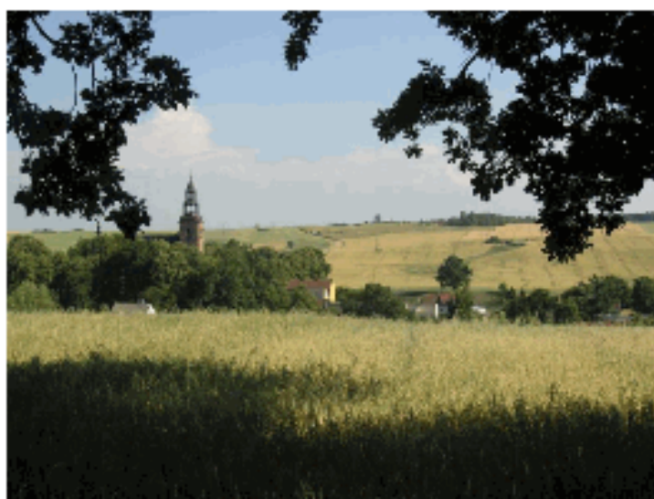
Widok wsi od strony północnej.

Celem pracy jest dokumentacja zabytkowej zieleni i układu przestrzennego Kalwarii Warmińskiej oraz wytyczne do gospodarki zielenią, które będą pomocne przy bieżącej pielęgnacji drzewostanu oraz projekcie konserwatorskim związanym z planowaną rewaloryzacją obiektu.