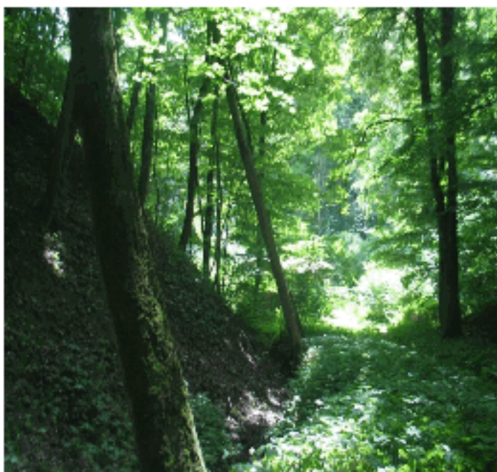
Fragment wąwozu Kalwarii Warmińskiej

Kalwaria Głotowska położona jest w głębokim wąwozie, jednak korony starodrzewia sięgają do wysokości 30 m co sprawia, że jest dobrze widoczna wśród otwartego rozłogu pól. Urozmaica panoramę wsi, podnosi walory estetyczne i ekologiczne krajobrazu. Siedmio hektarowy zadrzewiony teren jest ostoją ptaków i zwierząt. Ten specyficzny ekosystem położony nad rzeką Kwiełą powoli zmienia się w naturalny las.