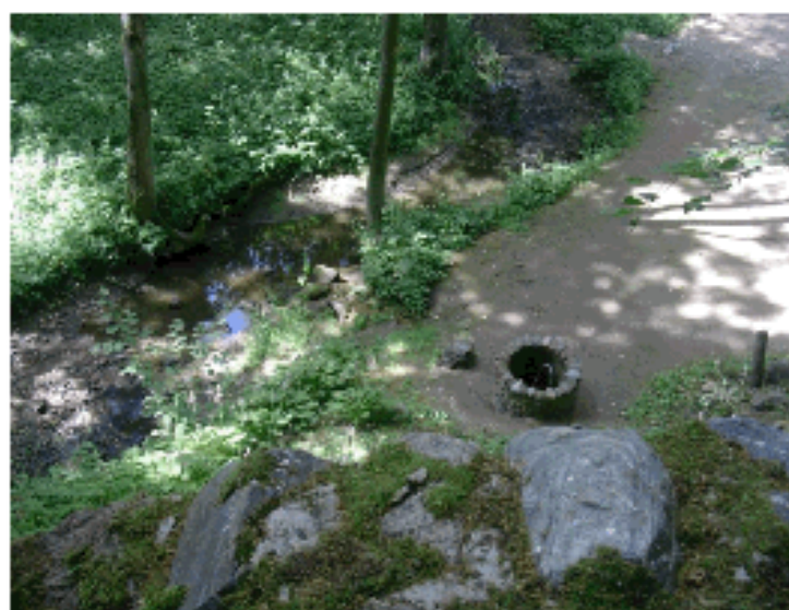
Fot. 6 A Chmielewski Źródło obok Groty Matki Boskiej z Lourdes

Głotowo położone jest w malowniczym wąwozie, którego dnem przepływa mała rzeka Kwieła, dopływ Łyny. Tuż za granicą założenia w przydrożnym rowie płynie ciek, który jest dopływem Kwieli. Rzeka jeszcze niedawno była czysta, jednak w ostatnich latach, w skutek nie kontrolowanej gospodarki wodnej spływają tu chemikalia z pól i ścieki sanitarne. Wiosną Kwieła wylewa, a w okresie letnim następuje znaczne obniżenie poziomu wody i rzeka zamienia się w płytkie błotniste kałuże.