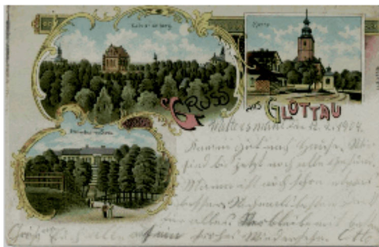
Il. 3 Widokówka pocztowa z XIX w.

Młeki Pańskiej i służyć wiernym jako miejsce kultu. Jednakże widoczna na starym planie sieć ścieżek spacerowych, fontanna i dodatkowe przejścia przez rzekę sugerują również funkcję rekreacyjno-spacerową obiektu. Także na pocztówkach z widokami Kalwarii Warmińskiej z początku XX w. można zauważyć osoby raczej spacerujące niż modlące się.