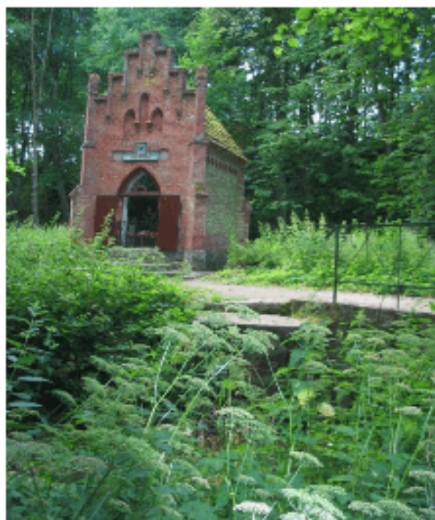
Fragment parku przy stacji VI

Stan techniczny ogrodzenia jest zły. Z powodu erozji podłoża oraz braku fundamentów ogrodzenie pochyla się i często wrasta w dzewa, co świadczy o tym, że nie było odnawiane ani zmieniane od momentu powstania. Wiele elementów rdzewieje, ogrodzenie ma liczne ubytki powstałe w wyniku działania człowieka (powyrywane siatki w miejscach nowych wydeptywanych ścieżek, dziury w siatkach).