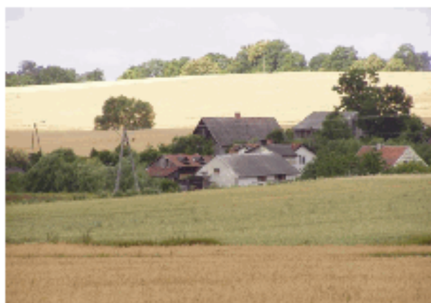
Widok wsi od strony południowej.

Etap ten polegał na rozpoznaniu najbliższego otoczenia, określeniu charakteru miejscowości, ogólnym zapoznaniu się z ukształtowaniem terenu Kalwarii Warmińskiej i okolicy, stosunkami hydrograficznymi, szatą roślinną występującymi na tym terenie nawierzchniami oraz małą architekturą.