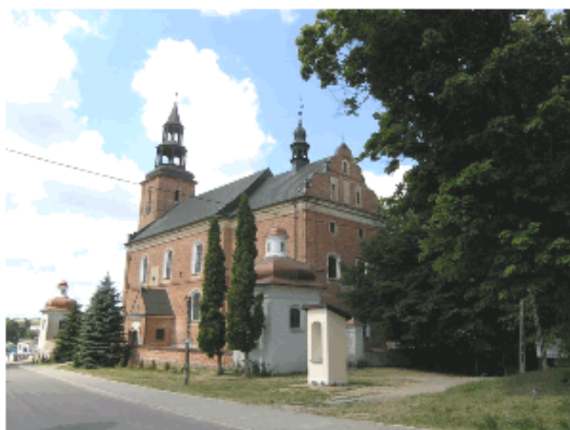
Widok Sanktuarium od strony wsi.

W Głotowie na szczególną uwagę zasługuje kościół pod wezwaniem Najświętszego Zbawiciela z XVIII w. Bogate wnętrze barokowej świątyni zawiera rzeźby i obrazy ukazujące postaci biblijne i postaci świętych związane z Najświętszym Sakramentem. Kościół zdobią secesyjne witraże i bogata polichromia na suficie. Wykonany jest on z czerwonej cegły z podmurówką kamienną, dach z blachy miedzianej. Otoczony jest murem wykonanym z czerwonej cegły na podmurówce z kamienia naturalnego. Mur pokryty jest czerwoną dachówką, od strony ulicy – płaską, z pozostałych stron pofalowaną. W narożnikach ogrodzenia znajdują się obiekty architektoniczne – kapliczki wykonane z czerwonej otynkowanej cegły.