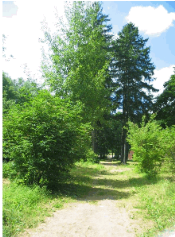
Alleja wyprowadzająca z Drogi Krzyżowej

Droga prowadząca do głównego wejścia kościoła wykonana jest z betonu, otoczona nawierzchnią z kamienia. Do zachodniego wejścia prowadzą kamienne schody. Od strony głównej bramy do wąwozu prowadzą schody wykonane z betonu, natomiast wszystkie stacje i kapliczki połączone są gruntową ubitą ścieżką, gdzie nawierzchnie stanowi mieszanka żwiru, piasku, drobnych kamyczków oraz gliny. Ścieżki poprzeczniane są korzeniami drzew. Do Groty Najświętszej Marii Panny prowadzi wydeptana ścieżka, wzdłuż której ułożone są kamienie. Strome podejścia rozwiązano w formie schodów wyłożonych brukiem z kamienia polnego.