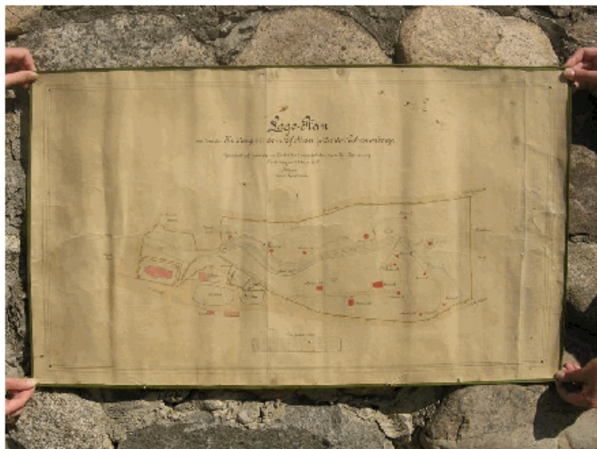
Mapa Kalwarii Warmińskiej z pocz. XX w. (w archiwum parafii w Głotowie)

- Lage – Plan von dem der Kirchengemeinde in Glottau gehörenden Kalvarienberge. Gezeichnet auf Grund der im Herbst 1909 ausgeführten specialen Vermessung. Heilsburgden 1. März 1910. Rocper (?), uprawniorny geodeta. Masstab 1:1000. Oryginał w archiwum parafii w Głotowie.