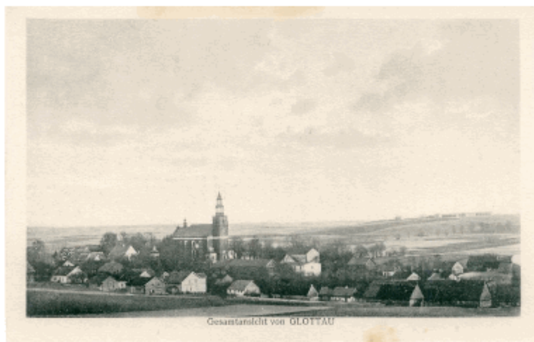
Il. 1. Widokówka z pocz. XX w.

Nazwa wsi pochodzi od nazwy Głotowia (terra Glotoviae), która w języku niemieckim brzmi Glottau, co na język polski tłumaczy się Głotowo bądź Głotowo. Według słownika nazw polskich (wg Chojnickiego) poprawna nazwa miejscowości to Głotowo. Nazwa ta występuje również w obiegu urzędowym po 1945 roku. Natomiast mieszkańcy w języku potocznym posługują się nazwą Głotowo.