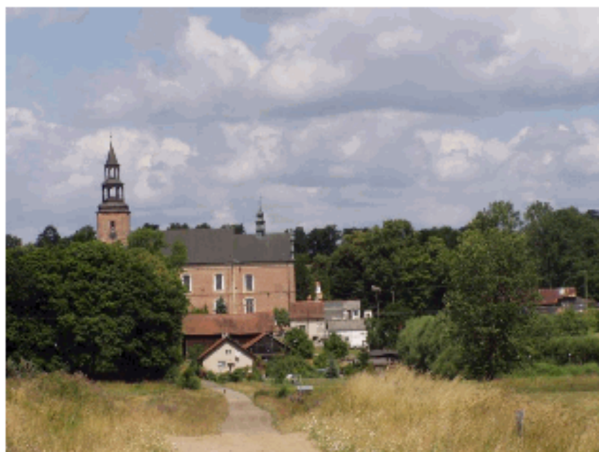
Widok Sanktuarium od południowej

Głotowo to niewielka warmińska wieś, która liczy obecnie około 500 mieszkańców. Znajduje się tu około 50 gospodarstw zlokalizowanych w pobliżu Kalwarii Warmińskiej i okolicznych koloniach. Punktem orientacyjnym wsi i otaczającego terenu jest wieża Sanktuarium. Niewątpliwie stanowi ona dominantę kulturową.