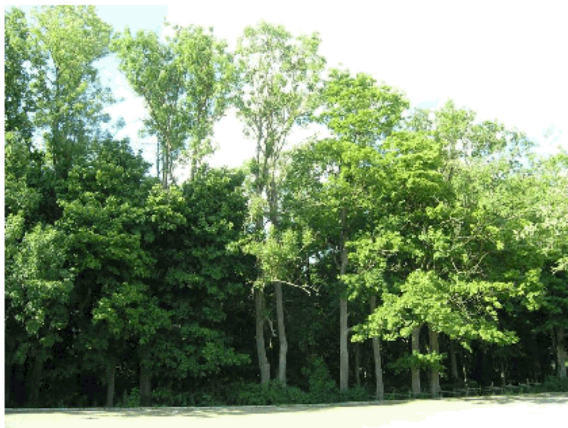
Usychające jesiony przy parkingu

jak i płaskie połacie terenu. Jego obecność związana jest z wysokim udziałem azotu i stosunkowo dużą żyznością siedliska. Z innych roślin azotolubnych występuje płatowo również pokrzywa. Miejscami duże przestrzenie porasta barwinek pospolity, bluszcz pospolity i imponujących rozmiarów lepiężnik różowy. W podszyciu sporadycznie pojawia się narecznica samcza, konwalia majowa i kokoryczka wonna. Oprócz roślinności zielnej występuje duża ilość siewek klonów.